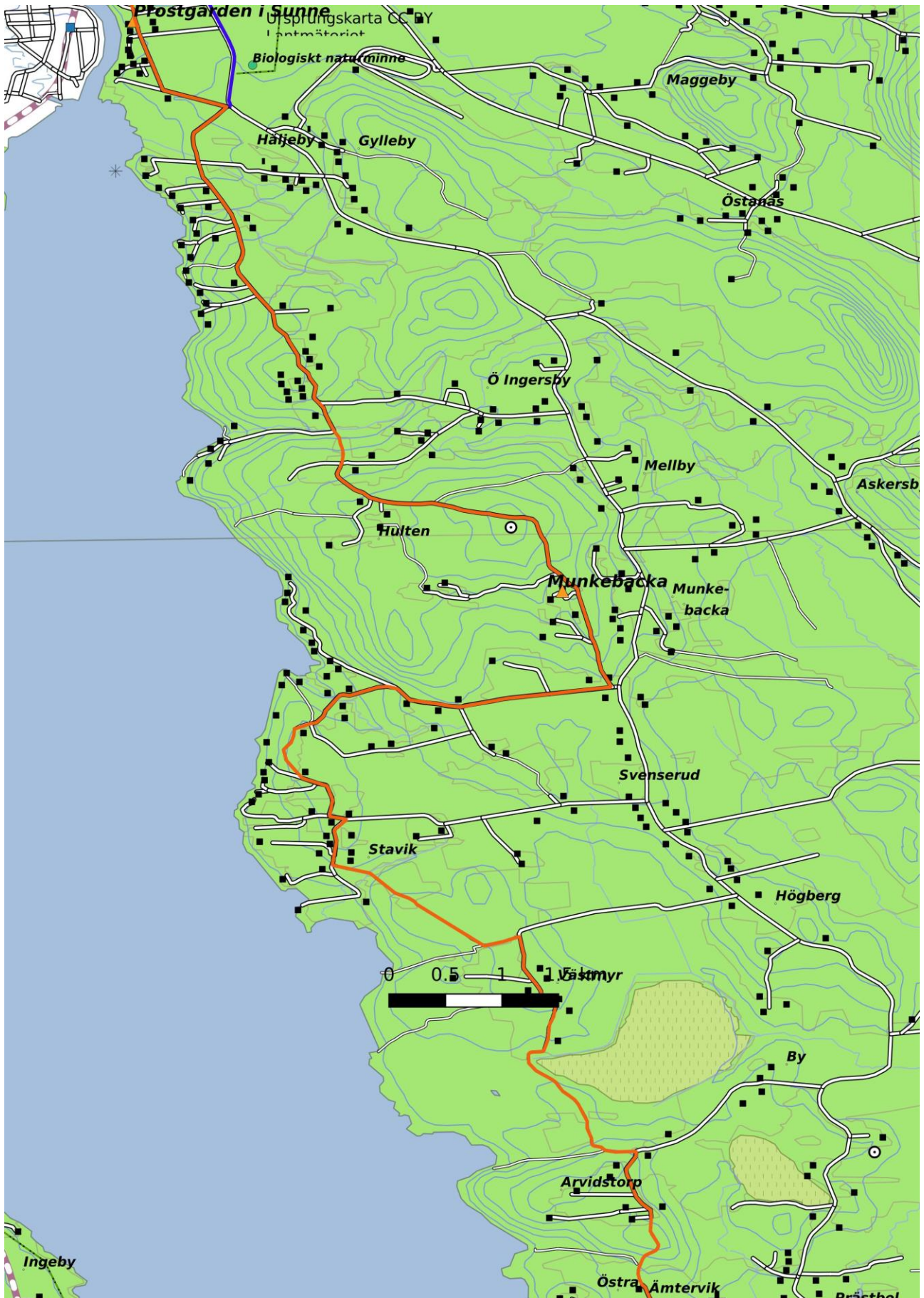
Fryksdalsleden, sträckan Östra Ämtervik – Sunne