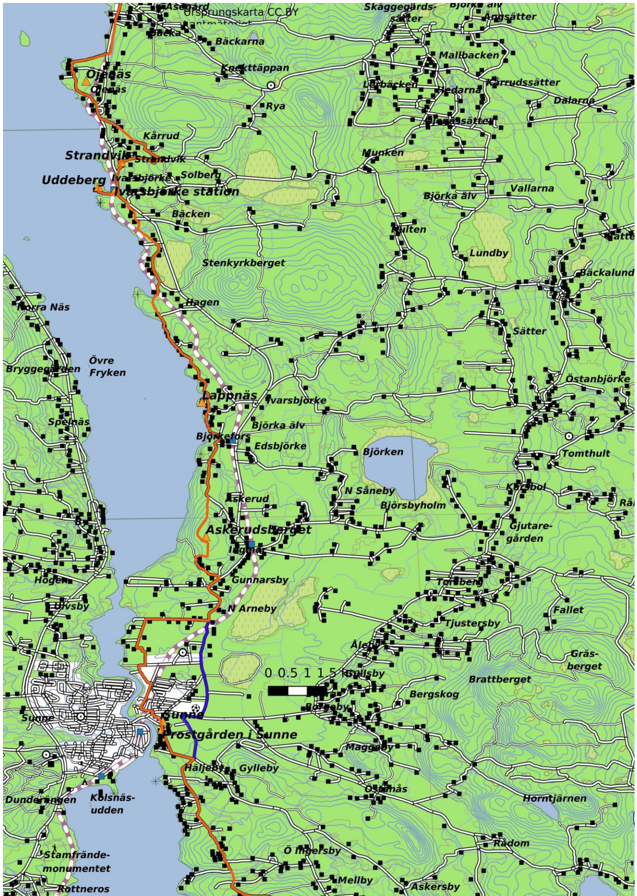
Fryksdalsleden, sträckan Sunne – Ivarsbjörke